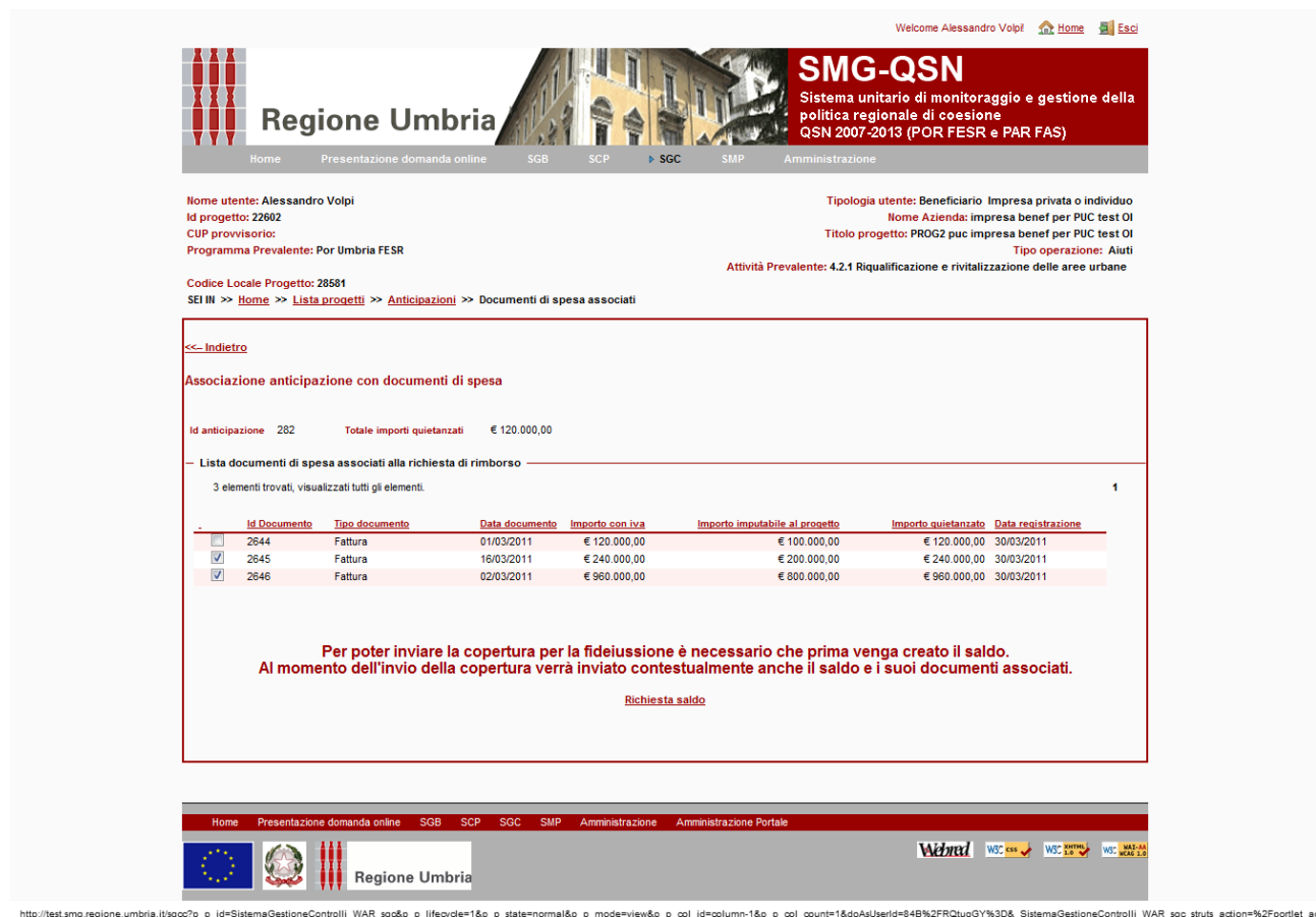
Fig21.: Rendicontazione-Richiesta saldo, associazione documenti di spesa per la copertura della fideiussione

A seguito di ciò l'utente clicca quindi sul link "richiesta saldo" e nella pagina che gli si apre provvede a digitare l'importo del saldo che vuole richiedere e quindi ad associare i giustificativi.